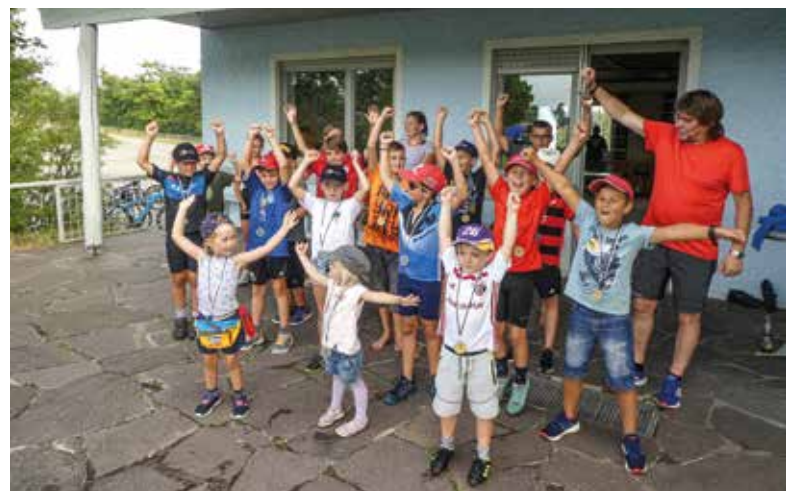
Siegerehrung Radl-Rallye – Coronakonform.