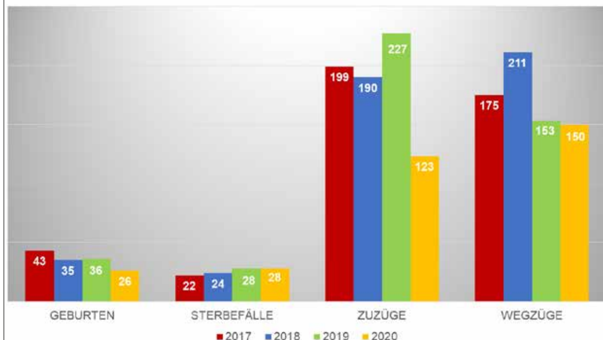
Geburten - Sterbefälle - Zuzüge - Wegzüge 2017 - 2018 - 2019 - 2020